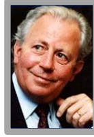
الرئيس جاك سانتير عضو البرلمان الأوروبي رئيس المفوضية الأوروبية الأسبق رئيس وزراء لوكسمبورغ الأسبق H.E. President Jacques Santer Member of the European Parliament Former President of the EU Commission Former Prime Minister of Luxembourg