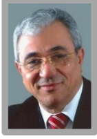
معالي تيجاني حداد وزير سابق H.E. Mr. Tijani Haddad Former Minister