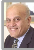
السير مجدي يعقوب بروفيسور في جراحة القلب مؤسس ورئيس جمعية نسلة الأمل الخيرية Sir Magdy Yacoub Professor of Cardiothoracic surgery Founder and President of the Chain of Hope charity