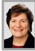
البارونة جيني تونغ سياسية عضو مجلس اللوردات البريطاني Baroness Jenny Tonge Politician Member of House of Lords