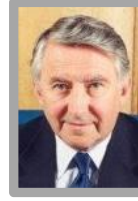
اللورد ديفيد ستيل رئيس البرلمان الاسكتلندي السابق زعيم حزب الأحرار الديمقراطي السابق R.H. Lord Steel of Aikwood, KBE, DL Former Speaker of the Scottish Parliament Former Leader of the Liberal Democrat Party