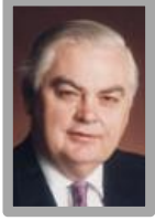
اللورد لامونت عضو مجلس إدارة مجموعة بالي وسيباف وزير الخزانة الأسبق R.H. Lord Lamont of Lerwick Director of Bali Group and CIPAF Former Chancellor of the Exchequer