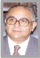
دولة الدكتور عبد السلام المجالي رئيس المعهد الإسلامي للعلوم رئيس وزراء الأردن الأسبق H.E. Dr. Abdul Salam Al-Majali President of Islamic Institute of Science Former Prime Minister of Jordan