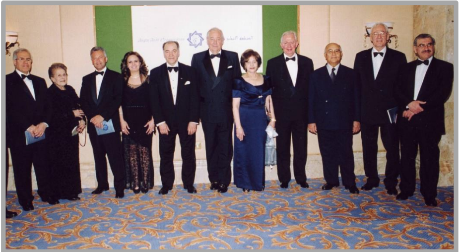
Members from the Board of Directors, Committee of Patrons, and Honorary Members at the launching of AAO

The Organisation shall enjoy all powers and rights which the law confers on juridical personalities, including the right of ownership, making donations, opening bank accounts, setting up trusts and employing people to achieve its objectives.