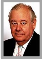
السير انتوني جوليف رئيس مجموعة جوليف الدولية عمدة لندن الأسبق Sir Anthony Jolliffe GBE, DL, DSc Chairman Jolliffe International Former Lord Mayor of London