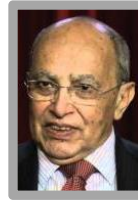
سعادة الدكتور عبد الكريم الارياني الأمين العام لمجلس الشعب اليمني رئيس وزراء اليمن السابق H.E. Dr. Abdul Karim El-Eryani Secretary General of the General Peoples' Congress. Former prime minister of Yemen