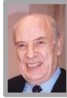
معالي السيد عدنان عمران أمين عام البرلمان العربي الموحد وزير سابق H.E. Mr. Adnan Omran Secretary General of the United Arab Parliament Former Minister