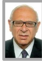
عظوفة القاضي بوجين قطران القاضي في المحاكم الانجليزية العليا سابقاً H.H. Judge Eugene Cotran Former English High Court Judge